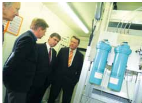
Sachsens Umweltminister Frank Kupfer (li.), Heinz-Peter Hausteine (re.) bei der Besichtigung der Luftmessstation

werden, der Ursache für die Geruchsbelastungen auf den Grund zu gehen.