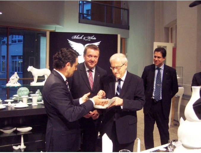
Rainer Brüderle zu Besuch in der Manufaktur Meissen

Für die Freie Mittelstandsvereinigung Saxonia e.V. war der November in diesem Jahr der Monat des Mittelstandes.