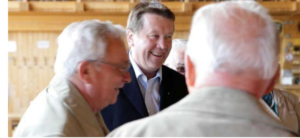
Heinz-Peter Haustein MdB im Bürgergespräch

Ich lade alle Bürgerinnen und Bürger, die ein Anliegen, ein Problem oder einen sonstigen Gesprächswunsch haben, zu meiner Bürgersprechstunde ein, die am