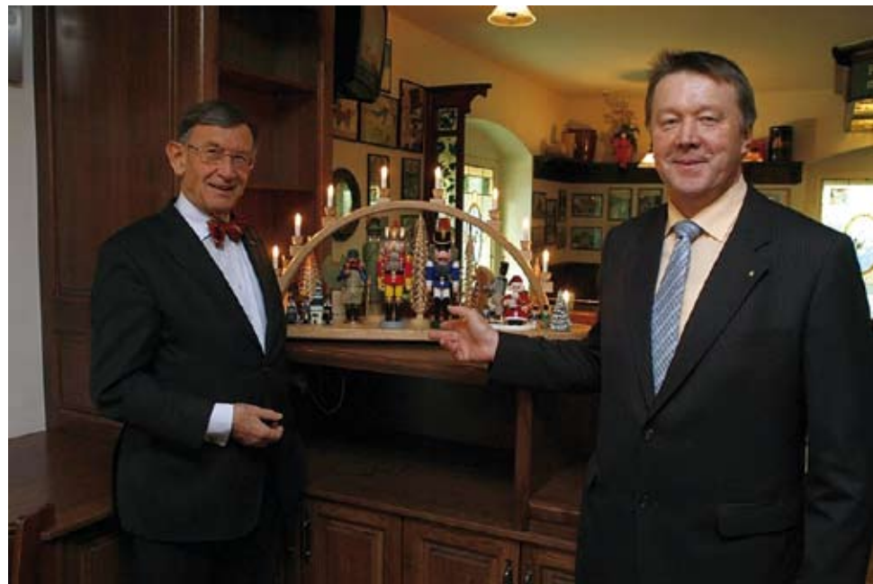
v.l.n.r. Prof. Dr. Heinz Riesenhuber (Präsident der Deutschen Parlamentarischen Gesellschaft), Heinz-Peter Haustein, MdB

Der Schwibbogen soll Allen Freude und Zuversicht geben. Möge er den Weihnachtsgedanken in die Herzen der Menschen tragen.