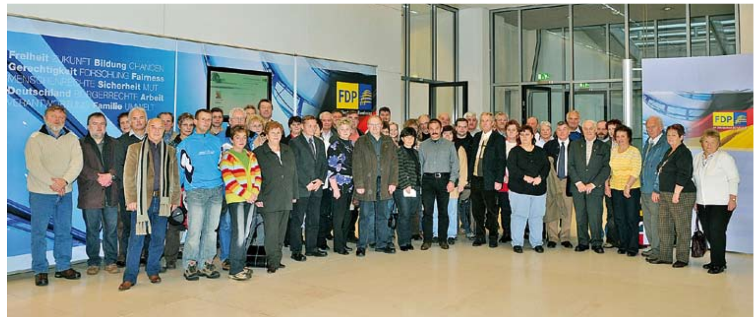
Besucherguppe November 2008

IMPRESSUM Herausgeber Heinz-Peter Haustein Platz der Republik 1 11011 Berlin Druck: Druckerei E. Gutermuth, Grünhainichen